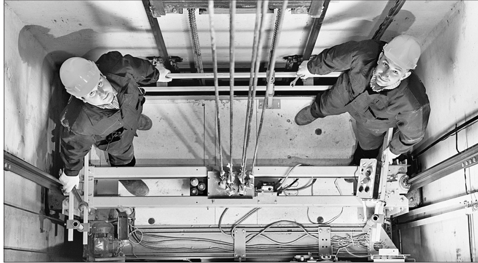
10 мільйонів цього року піде на ремонтні роботи ліфтового господарства міста

Нині управління ЖКГ збирає заявки від ОСББ щодо участі у програмі. Механізм подачі заявок такий. Голова правління ОСББ надає пакет документів до управління ЖКГ. Спеціалісти перевіряють усе, потім зі своїми зауваженнями спрямовують документи до депу-