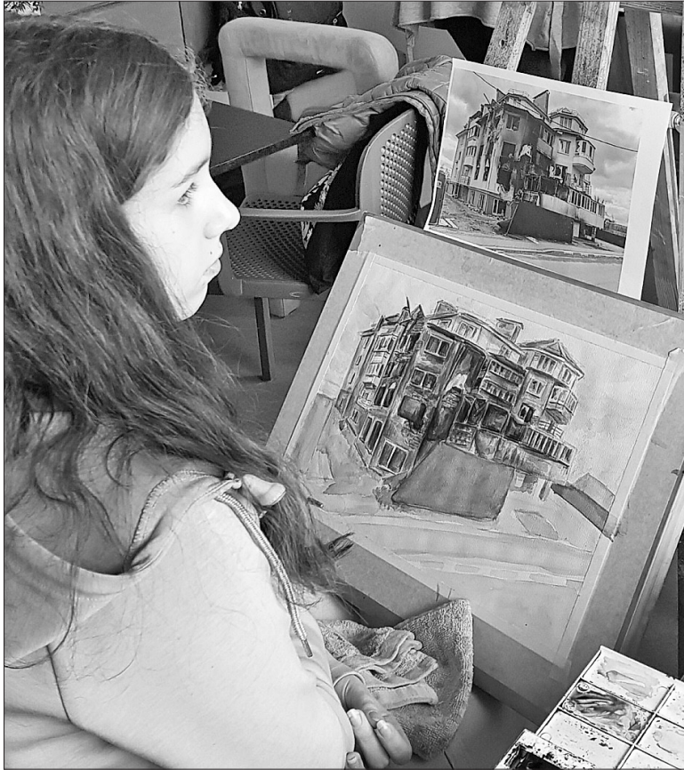
Бучанські діти теж долучилися до пленеру

А нинішні роботи планують у квітні показати на виставці. Ідея її така: на одній картині або фотографії будуть зруйновані локації, на іншій — відновлена архітектура, парк, місто. Адже пленер збі-